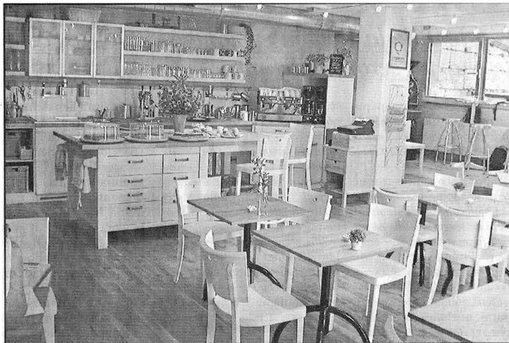
Au cœur de la vieille ville, un clin d'œil à la nature.

– Le Café, un nouvel espace convivial à Neuchâtel