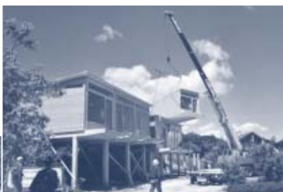
...la grue les placent, et à 16h00 tout est prêt !