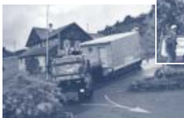
29 mai : à 7h30, les nouvelles chambres arrivent...