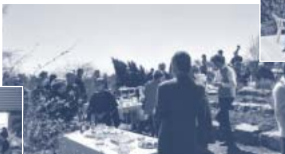
...suivie d'un apéritif musical au jardin...