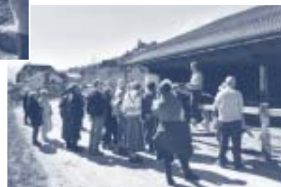
...et d'une visite de la ferme et des champs.