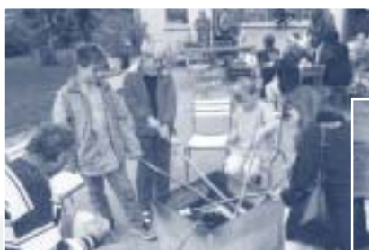
L'occasion de voir dans l'étable le film de Jürg Neuschwander sur la vache.