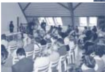
8 avril : la 20ème assemblée générale...